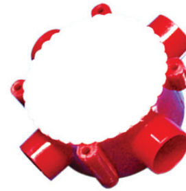
PE 4 Way Box