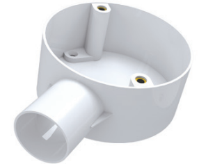
Circular 1 Way Box