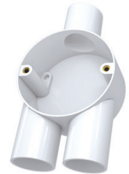
Circular Y Box