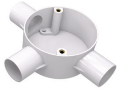
Circular 3 Way Box