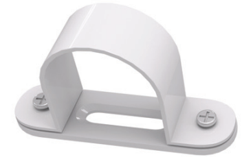
Space Bar saddle