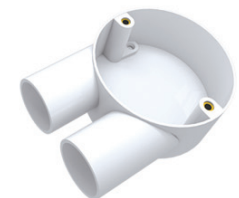
Circular U Box