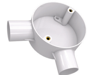
Circular 2 Way ( Angle ) Box