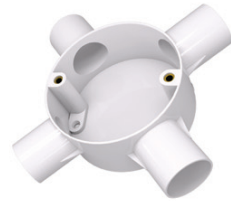
Circular 4 Way Box