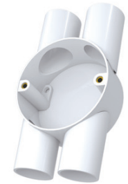
Circular H Box