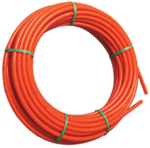
PE Pliable Conduits