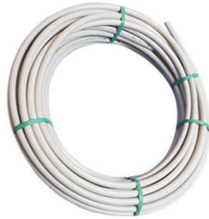
Flame Retardant Conduits