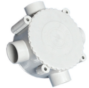
PE ( Self-extinguishing ) 4 Way Box