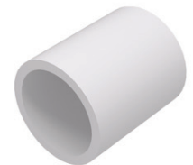
Reducer(Pipes to Ways)